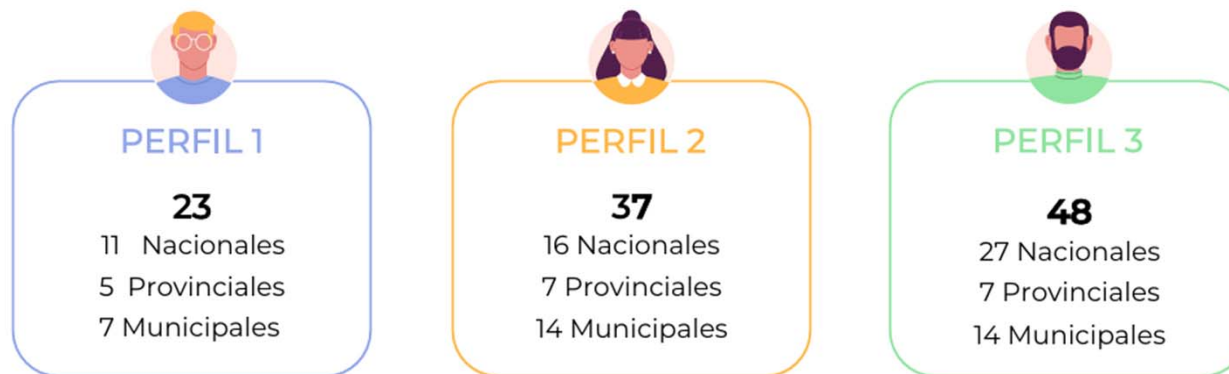
Cantidad de tributos abonados por perfil

En el caso de que los consumidores también compren tabaco o sus derivados, a estos números hay que añadirle 3 tributos obteniendo el resultado de 26, 40 y 51 tributos distintos por perfil.